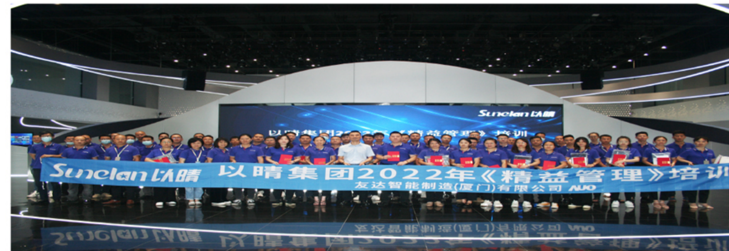
专题培训会集体合影

2022年7月17日,继本次年中工作计划总结及表彰任命大会之后,为进一步提升企业管理水平和先进理念,特邀请企业质量精益实战专家授课,为企业提供精益生产体系、管理方法和实践技巧等全方位培训。