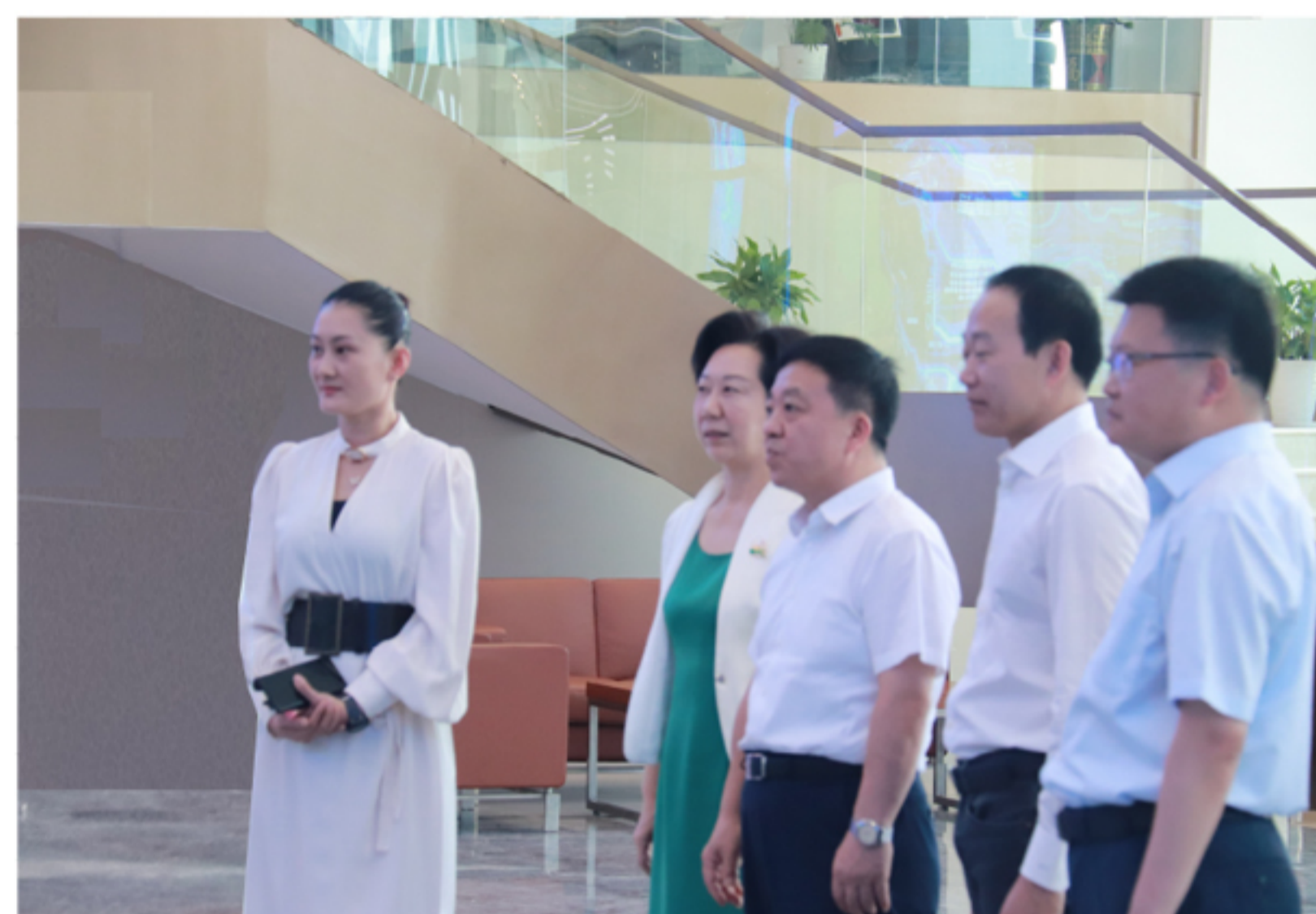
调研组一行参观企业产品展厅

2022年8月5日上午,江西省委副书记、省长叶建春一行莅临以晴数字经济产业园调研,以晴集团董事长周以晴、总裁洪哲森陪同调研。