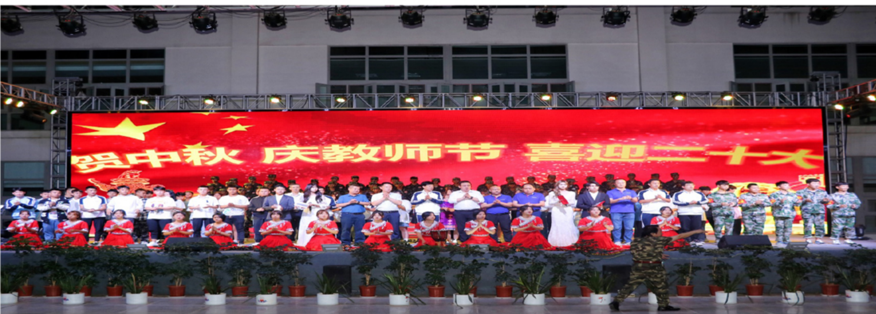
④ 文艺晚会集体合影

本次“贺中秋 庆教师节 喜迎二十大”文艺演出,不仅使学校师生感受浓郁的节日氛围,加深学校师生对中华传统节日的理解,更是丰富了学校师生的文化生活,充分展现了学校师生多才多艺、积极向上的精神面貌!