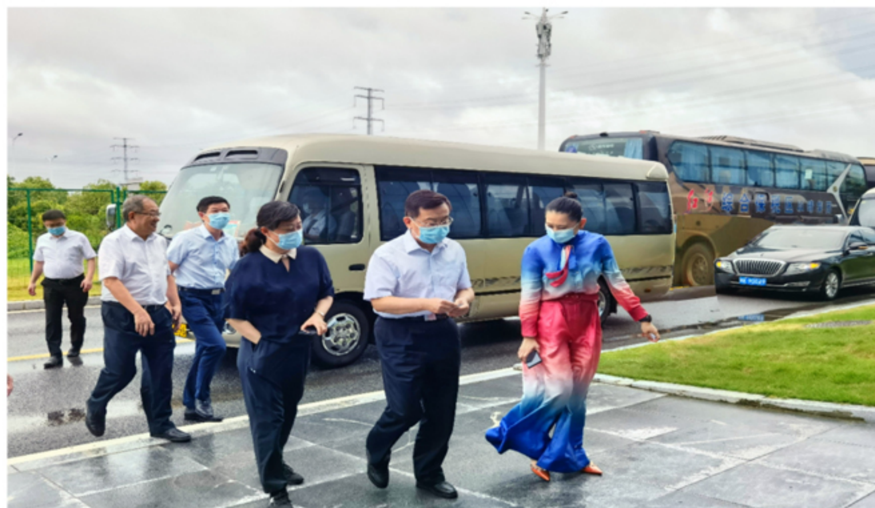
徐乐江书记一行莅临以晴集团调研指导

2022年8月4日下午,中央统战部副部长,全国工商联党组书记、常务副主席徐乐江,全国工商联党组成员、副主席李兆前一行莅临以晴集团考察调研,以晴集团董事长周以晴、总裁洪哲森陪同调研。