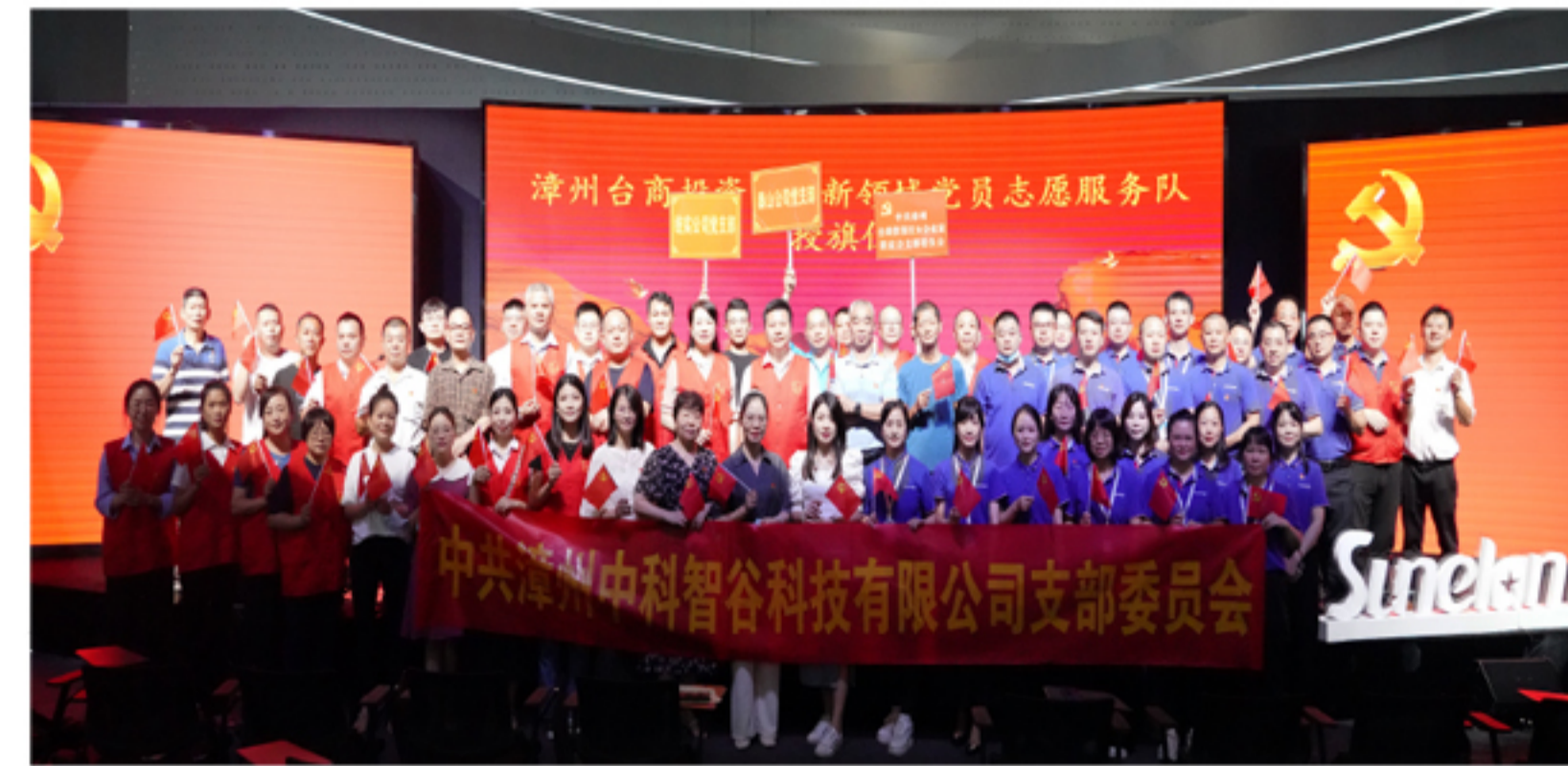
党建活动集体合影

授旗仪式结束后,党员志愿服务队立即在中科智谷园区开展“美化家园”志愿服务活动,党员志愿者们对路面、绿化带等区域的垃圾、纸屑进行清理整治。通过此次党建活动,党员志愿者们不仅彰显了不怕苦、不怕累的奉献精神,也通过实际行动为园区营造干净、整洁的办公环境,为广大群众树立了良好的示范作用。