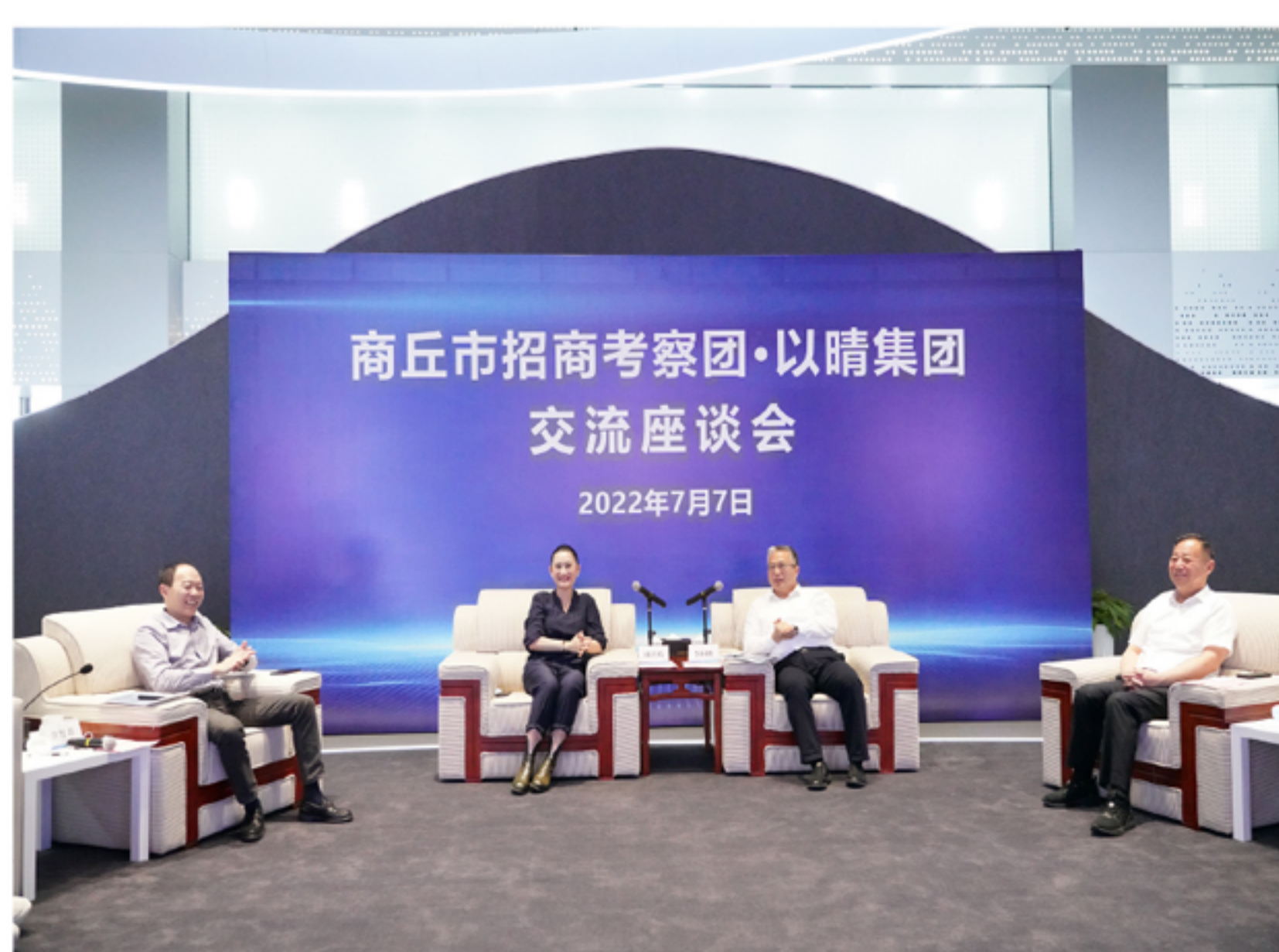
双方进行交流座谈