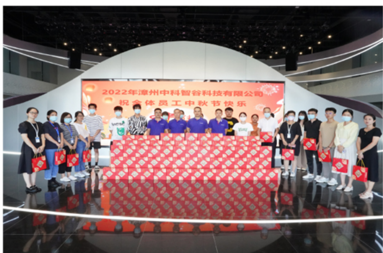
④ 中科智谷园区中秋节礼品发放现场

月到中秋分外明,人到佳节别样亲。此次活动的开展,充分体现了以晴集团对员工的人文关怀,使员工感受到了以晴大家庭的温暖,进一步提高了员工的凝聚力和向心力,相信在未来的日子里,每一位以晴人一定能再接再厉,奋力前行,共筑美好的明天!