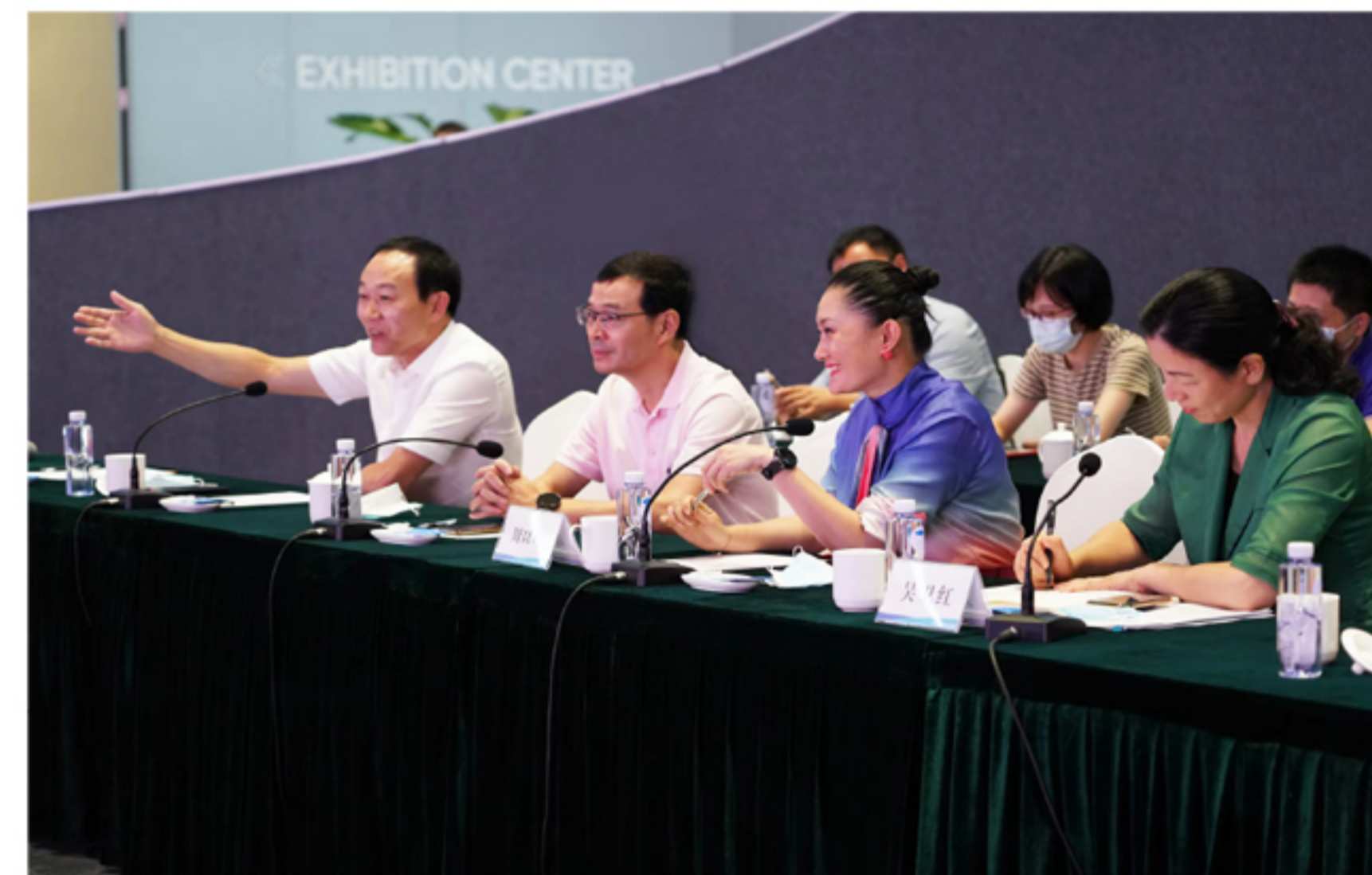
双方就企业相关情况进行深入交流