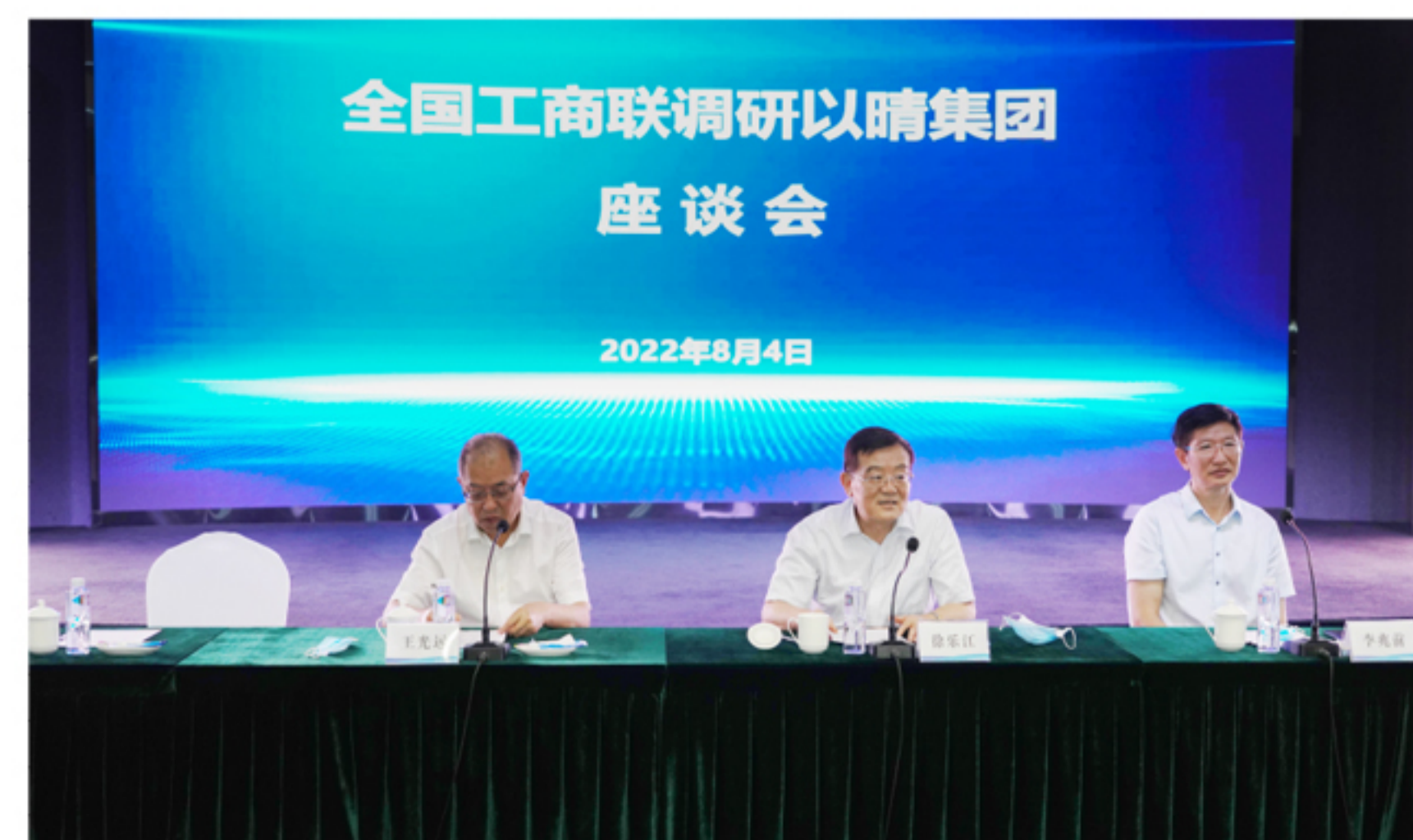
双方就企业相关情况进行深入交流