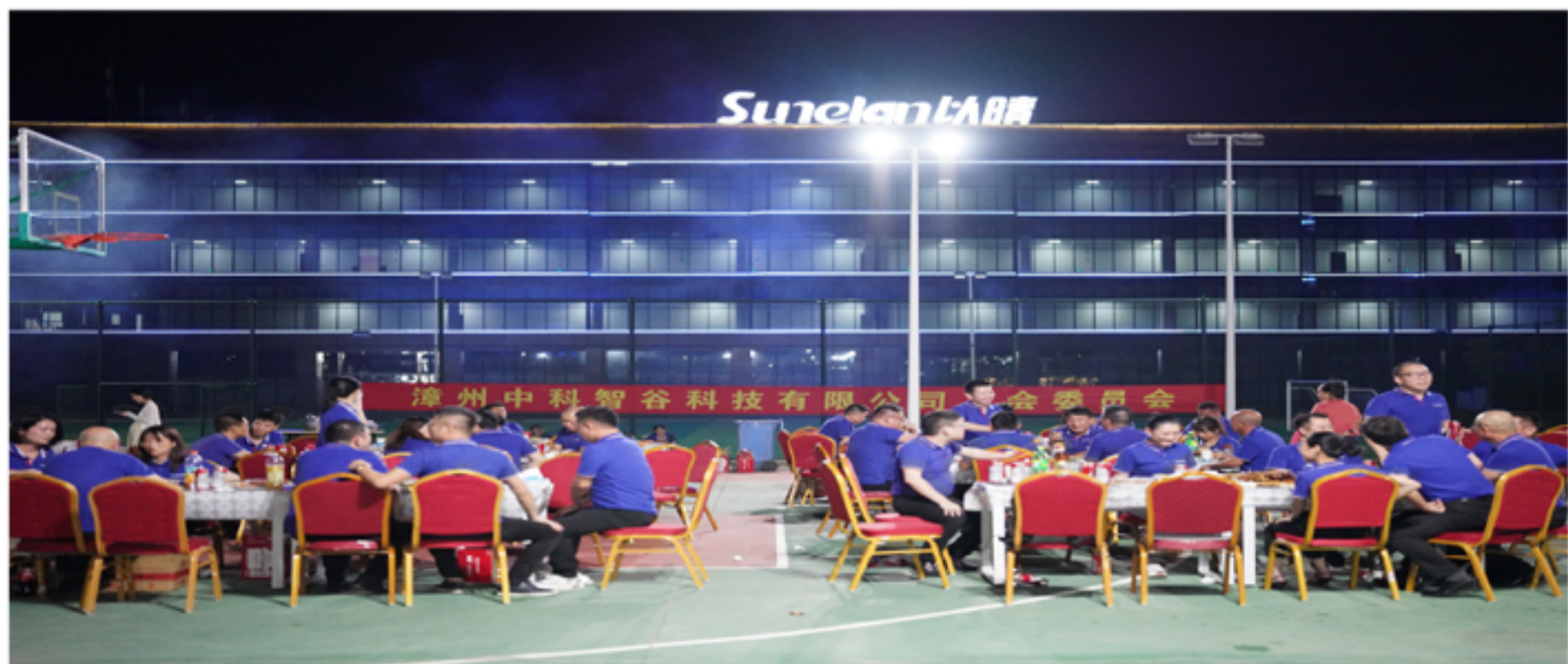
烧烤聚会活动现场