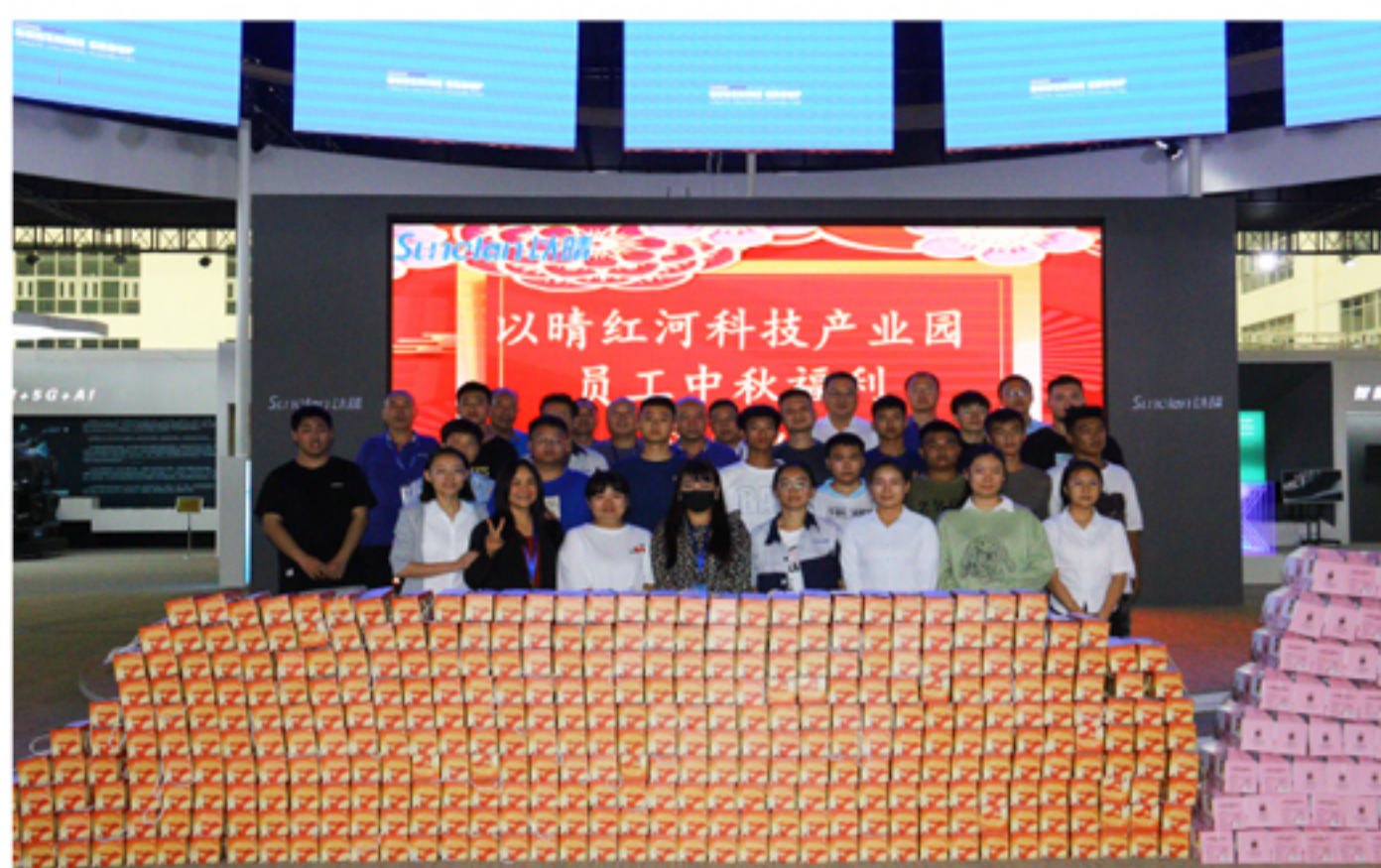
④ 云南园区中秋节礼品发放现场