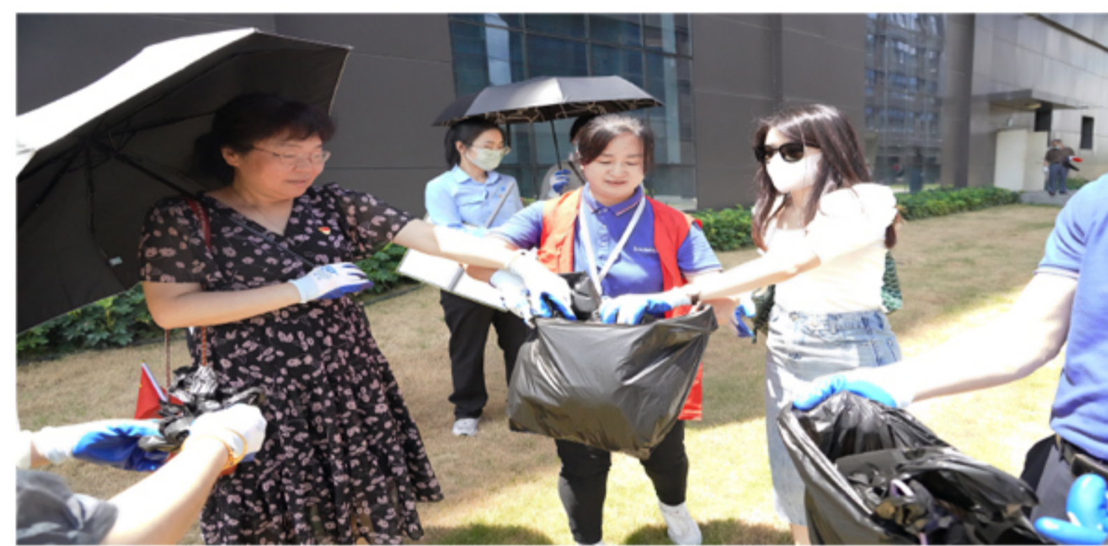
志愿服务活动现场

回首初心来时路,奋进启航新征程。此次“七一”党建活动既是一次生动的党性教育,更是一场深刻的思想洗礼,激励党员干部们坚定理想信念,强化使命担当,更好地发挥共产党员的先锋模范作用,在新时代新征程上奋发作为!