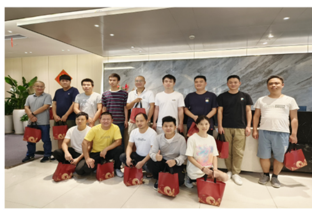
④ 深圳分公司中秋节礼品发放现场