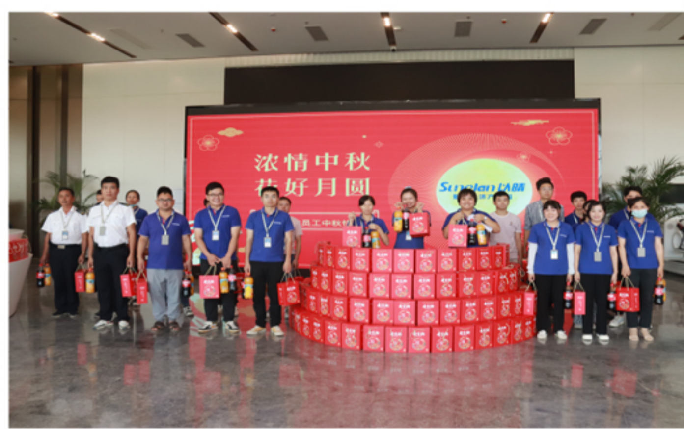
④ 江西园区中秋节礼品发放现场